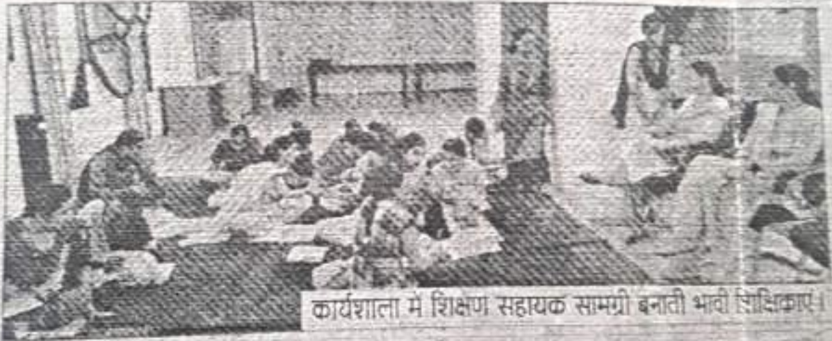
कार्यशाला में शिक्षण सहायक सामग्री बनाती भावी शिक्षिकाएँ।

सरसा (सच कहूँ न्यूज)। शाह सतनाम जी शिक्षण महाविद्यालय में 6 जुलाई से 10 जुलाई तक बीएड द्वितीय वर्ष के छात्राध्यापकों के लिए चार दिवसीय कार्यशाला का आयोजन किया गया। इस चार दिवसीय कार्यशाला में बीएड प्रशिक्षुओं को प्रायोगिक परीक्षा के लिए शिक्षण सहायक सामग्री को बनाने का प्रशिक्षण दिया गया।