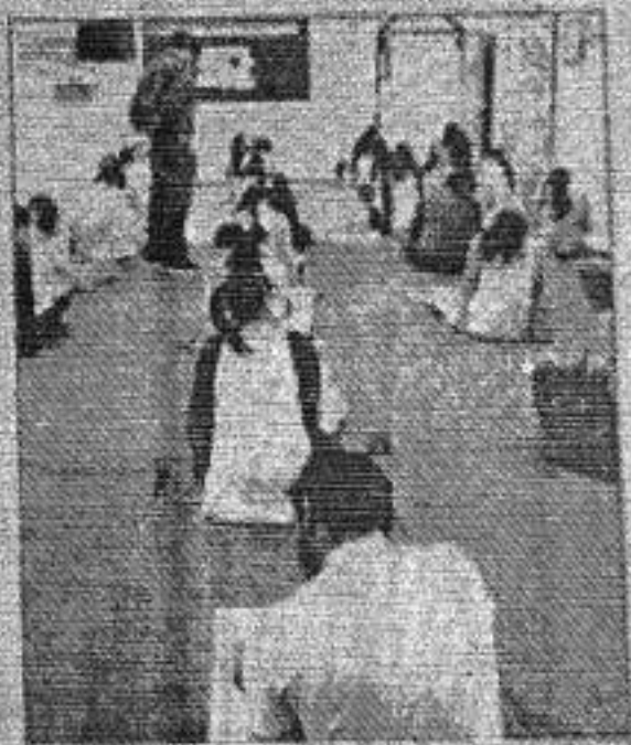
निबंध लेखन में भाग लेती छात्राएँ।