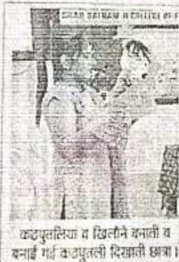
कठपुतलियां व खिलौने बनाने व बनाई गई कठपुतली दिखाती छात्र।